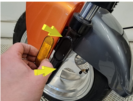
Asenna uusi heijastin paikalleen.