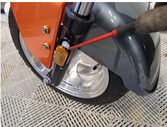
Kampea etujousen heijastin irti.